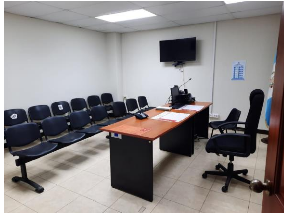
Foto: Sala de Audiencias virtuales del Juzgado de Paz de San Pedro Carchá, Alta Verapaz.

manejan un alto volumen de casos. Esto es una solución innovadora y eficaz para aumentar la cobertura de estos juzgados ya que la población asiste a uno de los juzgados de paz a nivel municipal y que se encuentra más cercano a su lugar de vivienda en vez de viajar y pagar el costo de transporte hacia la cabecera departamental (en algunos lugares esta se encuentra ubicada a una distancia de cinco horas). Esta movilidad requiere inversión de tiempo, recursos económicos e incluso pérdida de días laborales, según la distancia que se deba recorrer.